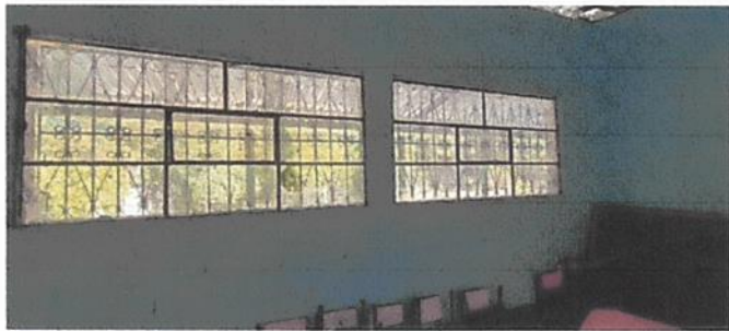
Suministro e instalacion de ventanas PVC