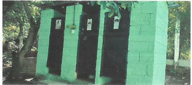
Susitucion de Puertas de baños