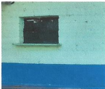
Matenimientos de ventanas de cocina