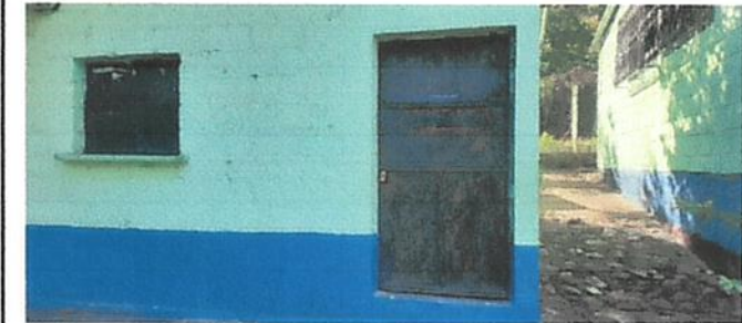
Sustitucion de de puerta de cocina