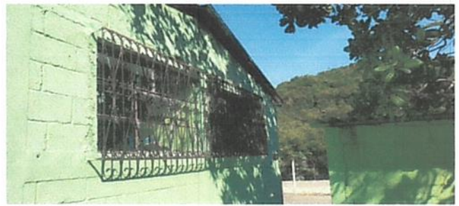
Mantenimiento de balcones en aulas