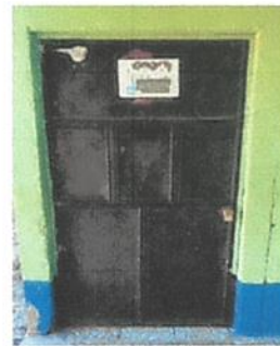
Suministro de instalcion de puertas en aulas direccion y bodega

Observación: Si es necesario se pueden agregar hojas adicionales y actualizar el número de hojas.